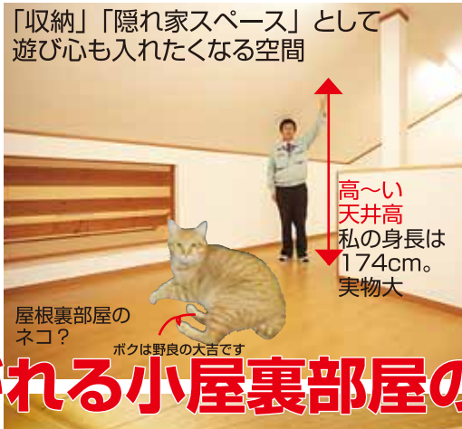
「収納」「隠れ家スペース」として遊び心も入れたくなる空間