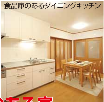
食品庫のあるダイニングキッチン