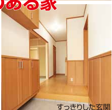
すっきりした玄関