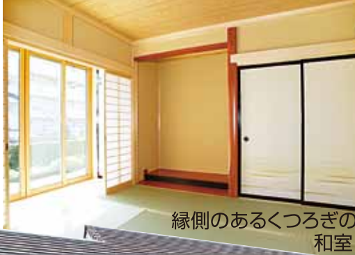
縁側のあるくつろぎの和室