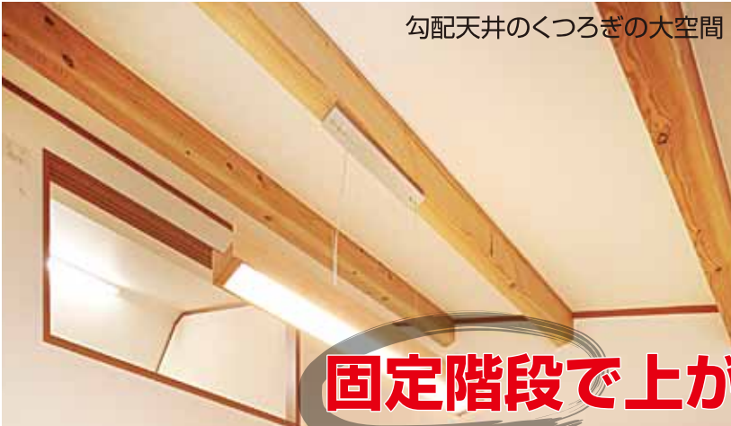
勾配天井のくつろぎの大空間